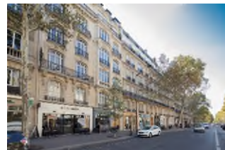
Paris 17 ème - 3, avenue de Villiers

A noter que la confrontation de décembre 2025 aura lieu le mardi 30 décembre, la date limite de réception des ordres étant fixé comme d'habitude le vendredi précédant la confrontation (soit le 26 décembre à 16H00).